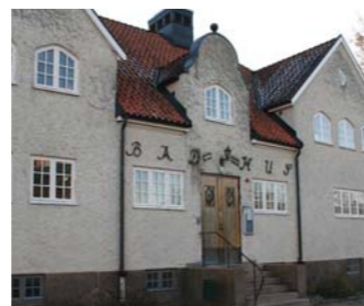
Vid Badhusparken ligger Gamla Varmbadhuset.