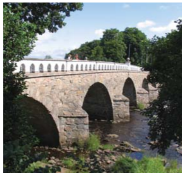
På andra sidan av Tullbron kan Ni skymta Borgen Falkenberg.

Tullbron har med rätta kallats "Sveriges vackraste stenbro" och är idag skyddad som byggnadsminne. Den gamla bron av trä ansågs vansklig att använda och dessutom ville man ha bron längre ner mot havet. Som plats för brofästet föreslogs borgen Falkenbergs ruiner. Arbetet påbörjades 1756 och tog nästan fem år. Arkitekten hette Carl Hårleman och efter hans död fullföljde Carl Cronstedt ritningarna. Den byggdes av knektar från Elfsborgs regemente och fångar från Varbergs fästning. Uttagande av brotull pågick ända fram till 1914. 1825 var brotullen 1 öre för gående, 2 öre för mindre boskapskreatur och 5 öre för häst. Post, soldater och fångtransporter hade fri passage. Det är just brotullen som givit bron dess namn.