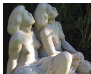
25. "Solbadande flickor" 1956, ekebergsmarmor, Thorwald Alef