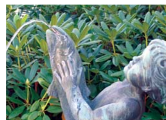
26. "Laxbrunnen" (Lax-Kalle) Falkenbergs första offentliga utsmyckning, 1938, brons, Bernard Andersson