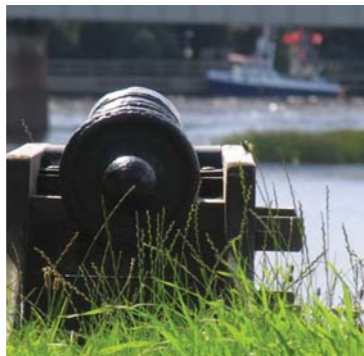
Vid ruinerna finns det bord och bänkar att rasta vid. Här står det ett konstverk i brons och granit.

(Falkenbergshus) Denna fästning uppfördes mot slutet av 1200-talet som en borg vid åns sista fors mot västerhavet och var den danska kungamakts utpost mot norr. Slottsherren Eskil Krak härskade år 1346 på Falkenbergshus och samma år anföll Hertig Erik av Sverige slottet. Kraks syster gömde, enligt sägen, slottets skatter i det underjordiska valvet där hon frivilligt inneslöts av nedrasade stenmassor. En ande i form av en tupp vakar sedan dess över jungfrun och skatten och gör dem osynliga för alla skattsökare. När Falkenberg en gång drabbas av nöd och fara skall tuppen gala, jungfrun vakna och överlämna skatten till Falkenberg. Ruinerna efter detta fäste, borgen Falkenberg, grävdes ut 1885 i samband med framdragningen av Mellersta Hallands Järnväg.