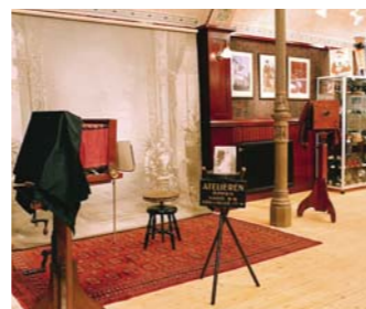
Efter Badhusparken fortsätter ni Brogatan/Sandgatan upp mot trafikljuset. Gå rakt fram tills ni ser Fotomuseet på höger sida.

...eller som det nu heter Kulturskolans hus. Detta vackra hus byggdes år 1914 för att täcka behovet för det tidiga 1900-talets "renlighetstänkare". Byggnaden var fram till 1983 stadens varmbadhus. När Klitterbadet, inomhusbadanläggning vid Skrea strand, togs i bruk lades verksamheten i gamla badhuset ner. Efter restaurering och viss ombyggnad flyttade Musikskolan in i huset 1984.