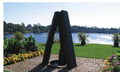
Vid Tullbron tar Ni vänster upp på Brogatan. Precis på höger sida ligger