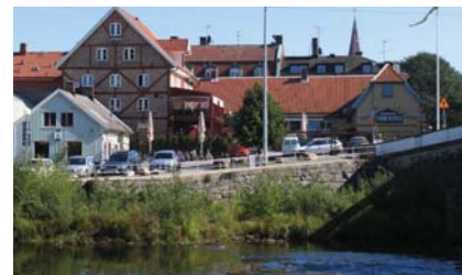
Fortsätt Brogatan upp tills Ni ser en vacker park på vänster sida - Badhusparken.