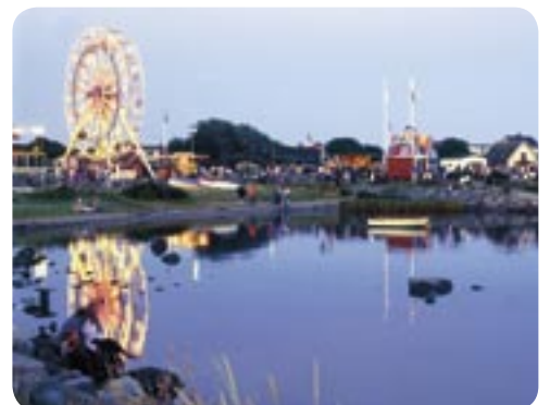
Kräftfestivalen i Glommen. Här njuter man av havets läckerheter under 5 dagar.