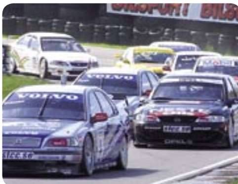
STCC och Västkustloppet på Falkenbergs Motorbana.