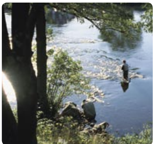
Ätrons Laxfiske, ett av Sveriges förnämsta. I kommunen finns ett flertal fiskrika åar och sjöar.

I Falkenberg blommar ett rikt kulturliv. Få kommuner i Sverige kan tävla med Falkenberg om antalet museer per invånare. Störst är Falkenbergs Museum vilket är inrett i ett gammalt sädesmagasin nere vid hamnen. Andra intressanta museer är t ex. Fotomuseet Olympia, Svedinos Bil- och Flygmuseum, Berte Museum (Livet på landet) och Lanthandelsmuseet. Konsten har givits en framträdande roll. Inte minst Sculptura visar att man vågar ställa ut konst och installationer av alla de slag.