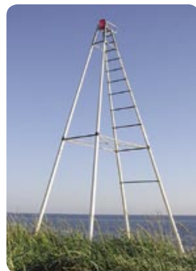
The lifeguard's chair (stanowisko ratownika) – jedna z instalacji pochodzących z Sculptura 02 .