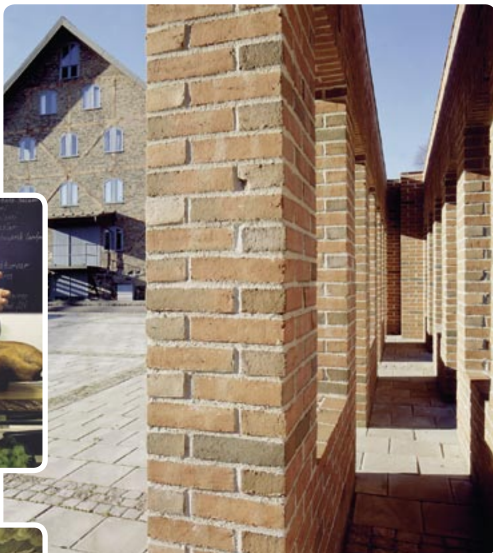
Muzeum Falkenberga prezentuje rozwój miasta w czasie ostatniego stulecia. Dzieło sztuki Pera Kirkeby przed muzeum.