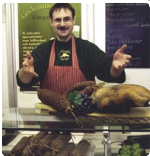
Wytwornia mies Gudmundsgarden jest częścią muzeum ekologicznego.

Muzeum ekologiczne Nedre Atradalen obejmuje ponad 70 wartych odwiedzenia ekspozycji w turystycznym rejonie Falkenberg. Ekspozycje przedstawiają zarówno przepiękną naturę, kulturowe dziedzictwo oraz sztukę ludową, aż do współczesności.