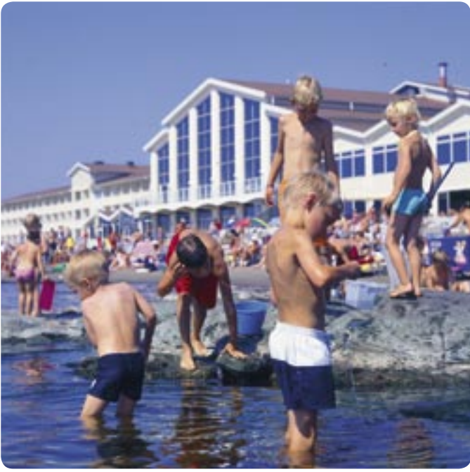
La plage de Skréa, avec le plus grand ponton de baignade de la côte ouest. Elite Hotel Strandbaden, hotel de tourisme et de conférences de première classe.

Falkenberg est un endroit unique sur la terre. Pour nous qui habitons ici, cela va de soi. Notre environnement est plein de contrastes. Nous aimons la mer avec ses longues plages de sable fin, la forêt et tous les nombreux lacs, le calme tranquille des agglomérations et les beaux paysages de la vallée de l'Ätran. Nous sommes particulièrement fiers de pouvoir proposer un large éventail d'événements. Tout ce que nous avons à Falkenberg nous le proposons avec joie et fierté.