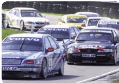
STCC et la course de la côte ouest sur le circuit de Falkenberg.