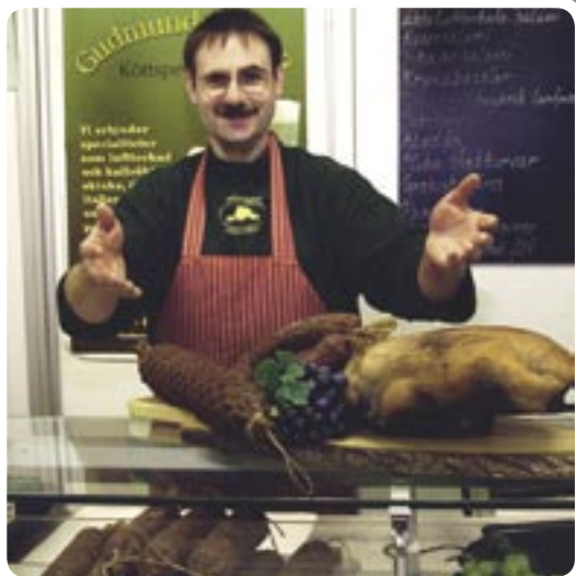
Gudmundsgården et ses spécialités en charcuterie, font partie de l'Ekomusée.