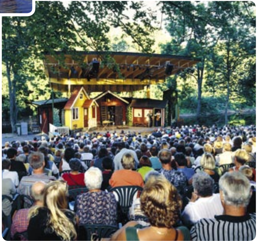
Le théâtre de plein-air Vallarna, situé dans un cadre magnifique au bord de la rivière Ätran. La farce de l'été (Sommarfarsen) est la plus grande manifestation estivale à Falkenberg.

Falkenberg est devenu un lieu de divertissement pour toute l'année. Des centaines de milliers de visiteurs viennent tous les ans, pour par exemple voir les spectacles d'été au théâtre de plein-air de Vallarna où bien encore la Revue de Falkenberg, participer au festival de la chanson ou aux journées du jazz dans les jardins du restaurant Hwittan, déguster les fruits de mer au festival des crustacés à Glommen, voir les courses automobiles au STCC ou encore voir l'une des centaines d'activités organisées aux alentours dans la commune.