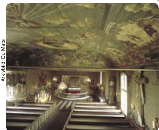
L'église de Gunnarp fait partie de l'Ekomusée