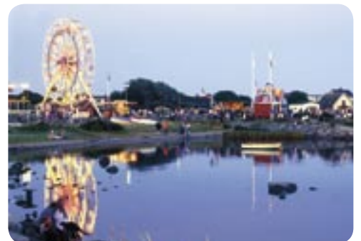
Kräftfestivalen i Glommen. Här njuter man av havets läckerheter under 5 dagar.