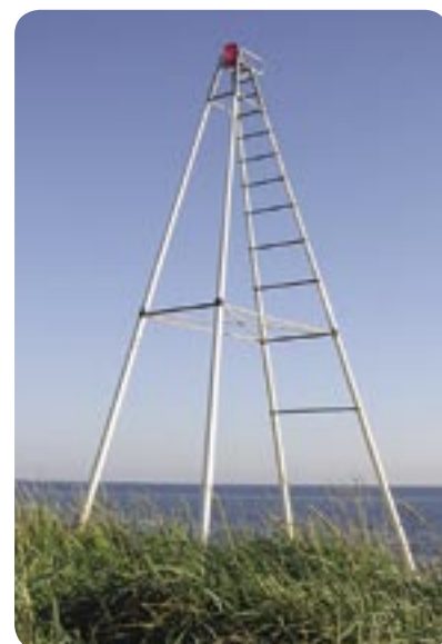
Badvaktstolen – en af installationerne fra Sculptura 02.