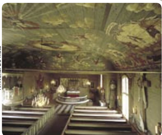
Gunnarps kirke indgår i Ekomuseet.

I Falkenberg blomstrer et rigt kulturliv. Få kommuner i Sverige kan konkurrere med Falkenberg i antal museer pr. indbygger. Størst er Falkenberg Museum, som er indrettet i et gammelt kornmagasin nede ved havnen. Andre interessante museer er f.eks. Fotomuseet Olympia, Svedinos Bil- & Flygmuseum, Berte Museum (Livet på landet), Lanthandelsmuseet og Seriemuseet. Kunsten har fået en fremtrædende rolle. Ikke mindst Sculptura viser, at man vover at udstille kunst og installationer af enhver art.